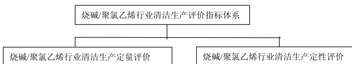
图 1 烧碱/聚氯乙烯行业清洁生产评价指标体系结构