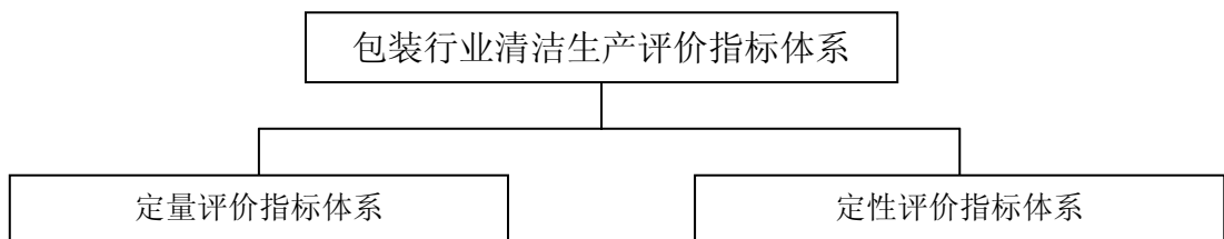
图 1 包装行业清洁生产评价指标体系结构